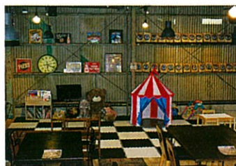
▲広々としたキッズスペース。お電話でのご予約で、キッズスペースに近いお席をご用意できます。