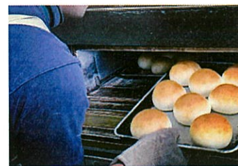
▲「パンズから始まるハンバーガー」がコンセプト。極限まで材料をシンプルにし、本当の美味しさを追求。主張はしすぎず、でも印象は残る「金のパンズ」の製造にたどり着いた。