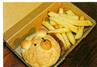
▲お子様に人気の「キッズバーガーセット」499円(税抜き)。ドリンクと風船付き。かわいくまんパンズでテンションUP。食後は風船をもってキッズスペースで遊ぼう。