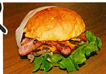
▲人気No.1の「エッグ&ベーコン」770円(税抜き)バーガーと卵とベーコンの一体感が美味。