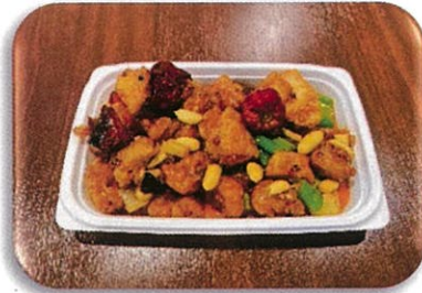
鶏とナッツのピリ辛炒め